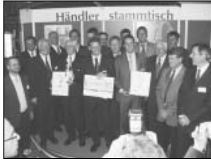
Wilhelm Fricke GmbH (Heeslingen)