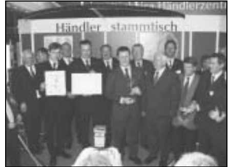
RCG Technik Münsterland GmbH (Coesfeld)