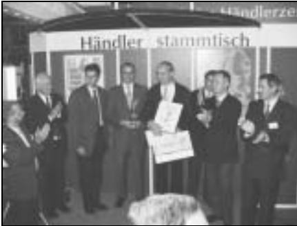
Rebo GmbH (Rechterfeld)

Im November 2003 ehrte die Redaktion AGRARTECHNIK und auf der AGRITECHNICA die besten deutschen Landmaschinen-Fachbetrieb mit dem SHELL-Service-AWARD. Die Bundessieger waren die Firmen Rebo GmbH (Rechterfeld), Wilhelm Fricke GmbH (Heeslingen) und RCG Technik Münsterland GmbH (Coesfeld) – hier im Bild: