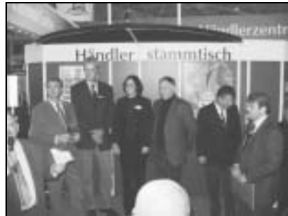
Josef Greving Landmaschinen (Ahaus-Wüllen)