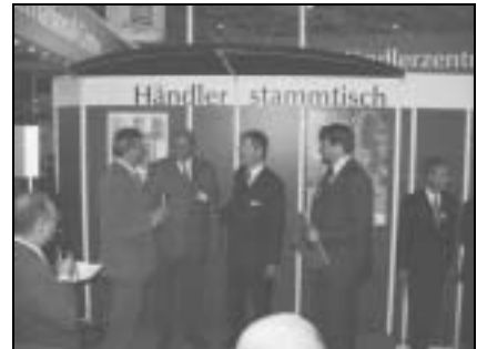
Eckhardt Land- & Gartentechnik GmbH (Helmstedt)